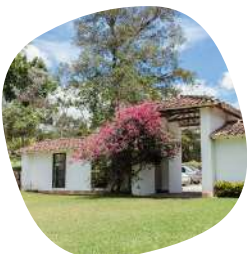
Hotel Recinto Quirama (El Carmen de Viboral)