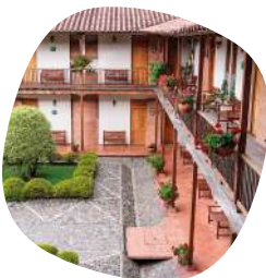
Hotel Hacienda Balandú (Jardín)

Además, no te puedes perder la oportunidad de alojarte con nosotros una noche adicional por tan solo $93.000