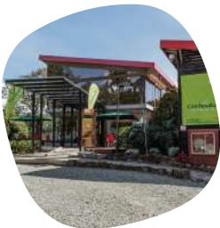
Hotel Piedras Blancas (Santa Elena)