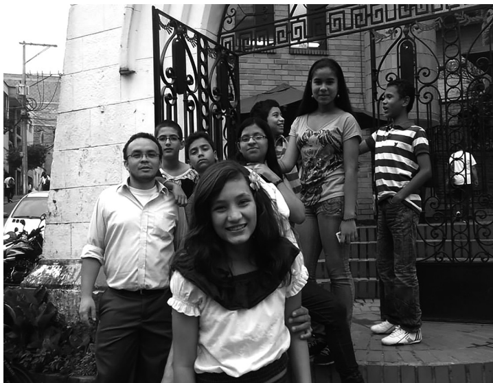
Visita a la Casa de la Cultura Cerro del Ángel (Bello), el 31 de mayo de 2013.