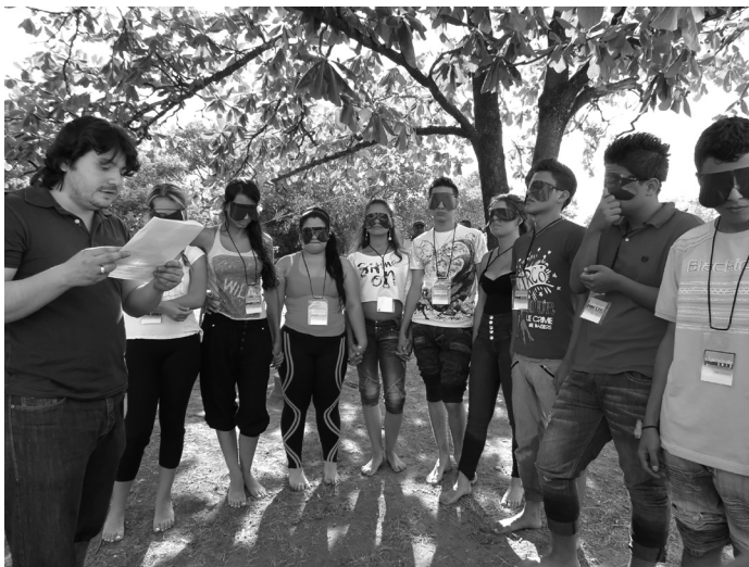
Parque Biblioteca Belén, Plaza Verde – Apersónate 2012.

Luego de estos años de realización del programa reconocemos que la experiencia pedagógica de Apersónate es un saber práctico que ha sido construido a través del sistema de relaciones de los participantes, facilitadores, estudiantes, adultos significativos, instituciones educativas y demás actores involucrados.