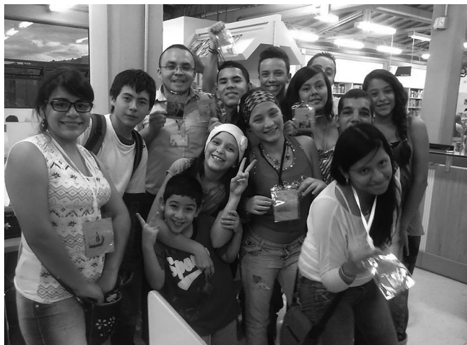
“Sueños en Pañales”.