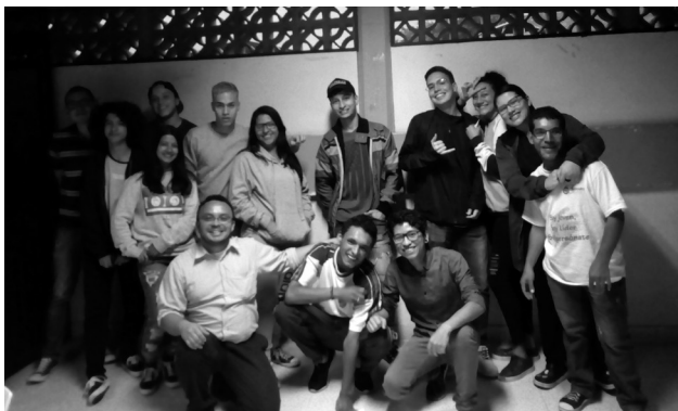
Reencuentro de los “Emigrantes de ayer y hoy”, el lunes 30 de septiembre de 2019, en la Biblioteca Niquía.