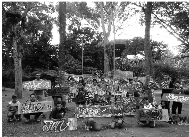
Jornada de Inmersiones desarrollada en la tarde del lunes 29 de octubre de 2012, en el Jardín Botánico Joaquín Antonio Uribe (Medellín).

cluso se visitó la Biblioteca Pública y Parque Cultural Débora Arango, ubicada en el municipio de Envigado 3 , al sur del Valle de Aburrá.