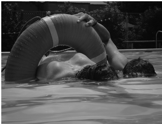
Inmersión acuática Parque Comfenalco Guayabal 2011.