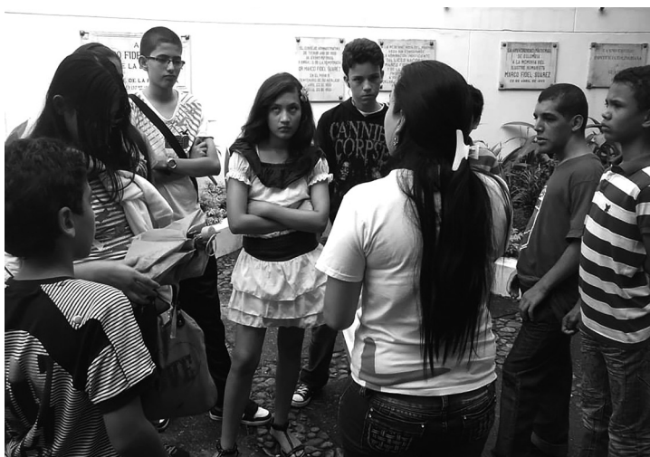
Visita guiada en la Chozza de Marco Fidel Suárez (Bello), el 31 de mayo de 2013.