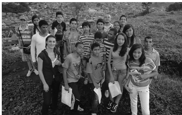
Recorrido de inmersión en Moravia (Medellín), el 7 de noviembre de 2013.