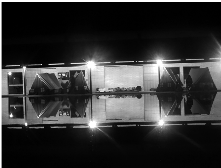
Parque Biblioteca Belén. Campus para la democracia – Apersónate 2012.

Durante los años siguientes se mantuvo la estructura por ciclos; por ello, en los próximos párrafos nos centraremos en algunas acciones que fueron apareciendo como los Clubes Apersónate, las inmersiones, así como en otras que ya existían y se siguieron fortaleciendo como el caso de los eventos centrales – Seminario-taller, en los que los jóvenes participantes de cada una de las Bibliotecas de Comfenalco, se reunían en un lugar al aire libre de la ciudad o de los municipios cercanos, para compartir y seguir construyendo en red.