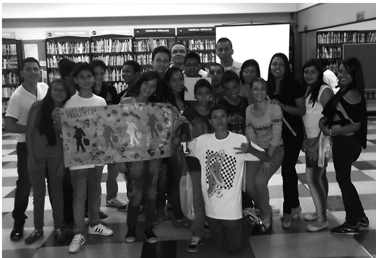
Club Emigrantes Niquía: Encuentro de grupos Apersónate en la Biblioteca Sede Escolar Colombia de Comfenalco (Medellín), el 30 de octubre de 2013.

Cuando hago el anterior recorrido deseo expresar que, desde mi opinión, el programa Apersónate logró ser una propuesta transversal, así como hoy lo son para el Departamento de Bibliotecas estrategias como “Al Calor de las palabras” o el “Bibliocirco” de la Fiesta del Libro y la Cultura, en la medida que para todo el equipo de trabajo de las bibliotecas no pasaba desapercibido lo que acontecía con Apersónate durante el año, fuera por los eventos centrales del programa o por los encuentros de los clubes en cada Biblioteca.